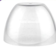
Maman de mai Bouchon en forme de dôme