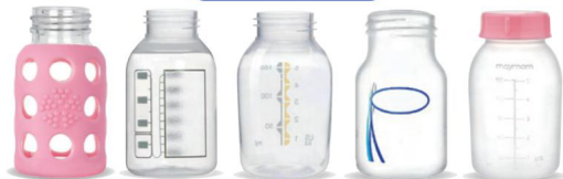
Fabbrica della vita Ameda