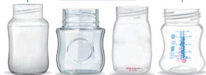
Avent Classic Avent Spettri naturali