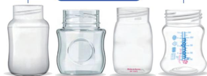
Avent Classic Avent Naturspektren