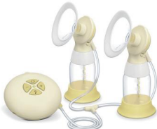
Medela Swing Flex