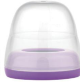
Maman de mai