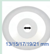
Medela PersonalFit Flex Protège-seins