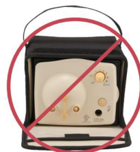
Pompes avec style